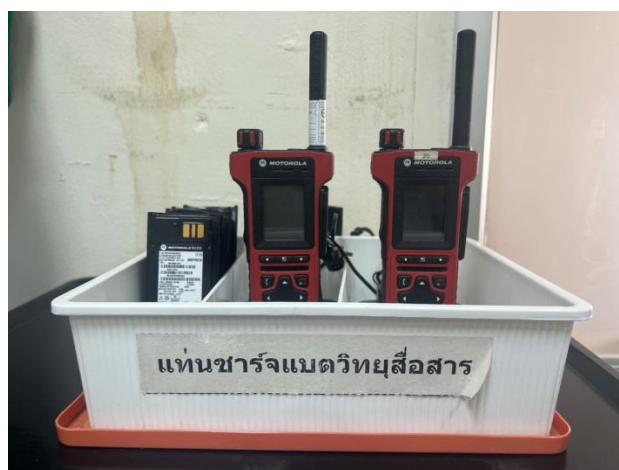
วิทยุสื่อสาร