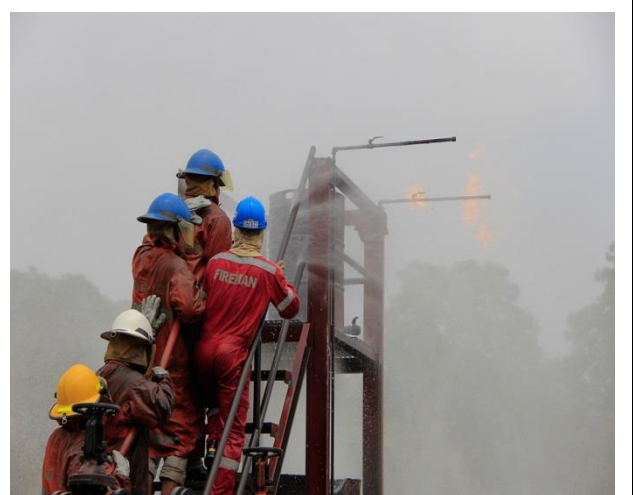
การฝึกอบรม หลักสูตร “เทคนิคการเข้าผจญเพลิง” ที่สนามซ้อมดับเพลิง โรงปูนสระบุรี